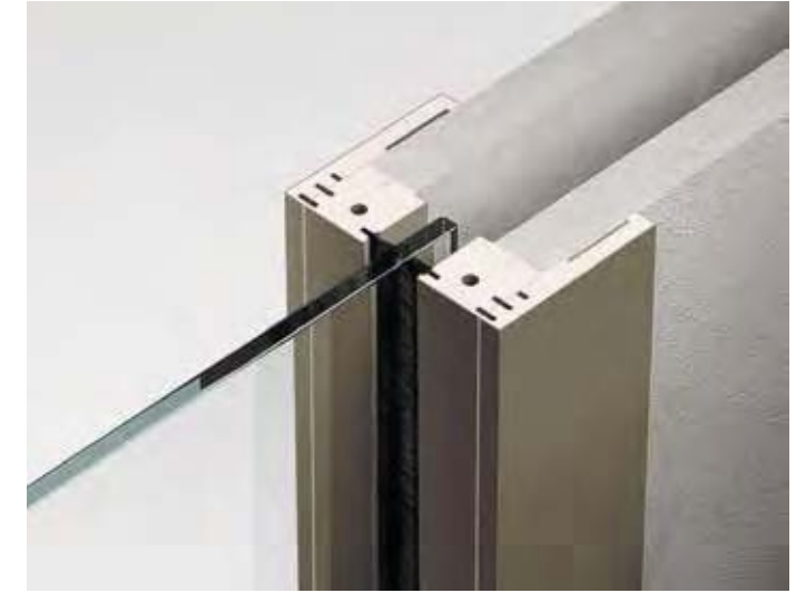
Stipite Xilo Xilo frame

Traditional frame made of fir wood listel with covers in matt lacquered mdf or matt lacquered brushed ash within the 12 Henry Glass lacquered finishes or RAL on demand.