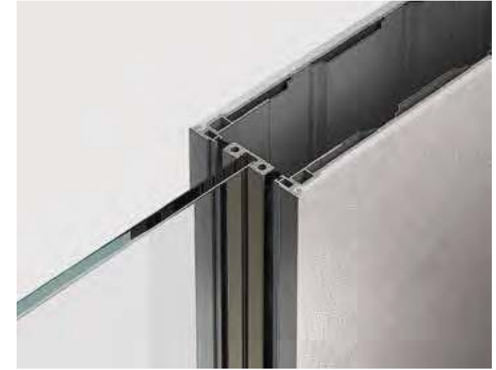
Predisposizione per cassonetto Scrigno® Essential Arrangement for Scrigno metal box® Essential

On the market, there are specific counter frames for disappearing sliding doors, especially designed for the installation of glass doors without visible external elements.